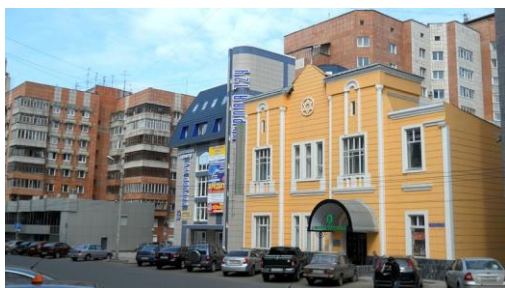
Рисунок 4. Синагога, г. Пермь

Синагога – пункт № 1. Больше всего нам запомнился банк в здании Синагоги.