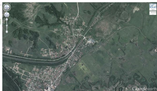
Рисунок 1. Снимок со спутника п. Мысы Краснокамского муниципального района.

Актуальность применения данной методики и технологии обусловлена интерактивностью и наглядность ресурсов. Приведем ряд примеров (Рис.1, Рис.2).