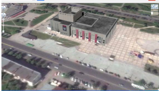
Рисунок 2. Театр-Театр, г. Пермь.

Сервисы фотография/видео/Википедия позволяют отражать фотографии интересных мест, видео-записи, связанные с изучаемой территорией, а благодаря синхронизации с Википедией появляется возможность получить текстовую информацию о том или ином муниципалитете/объекте и т.д. (Рис.3).