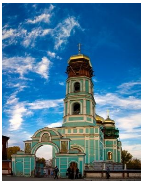
Рисунок 6. Свято-Троицкий кафедральный собор, г. Пермь

Свято-Троицкий кафедральный собор – пункт №3. Больше всего нам запомнился большой золотой купол церкви.